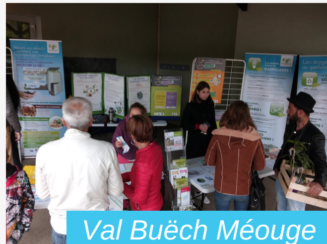
Val Buëch Méouge

Le Pôle Environnement lance un vaste programme de sensibilisation sur l'ensemble du territoire. Depuis le mois de mai, de nombreuses actions ont été menées auprès des habitants et des écoliers avec notamment : un stand d'information lors de la fête des plantes à Val Buëch Méouge, une rencontre autour du composteur collectif installé aux Jardins d'Anthony à Laragne, l'intervention contre le gaspillage alimentaire à l'école de La Motte-du-Caire, la visite du centre de tri des déchets de Manosque avec l'école de Verdun de Sisteron, le pique-nique « Zéro déchet » et les jeux du tri des déchets avec les enfants des écoles et du collège de Serres.