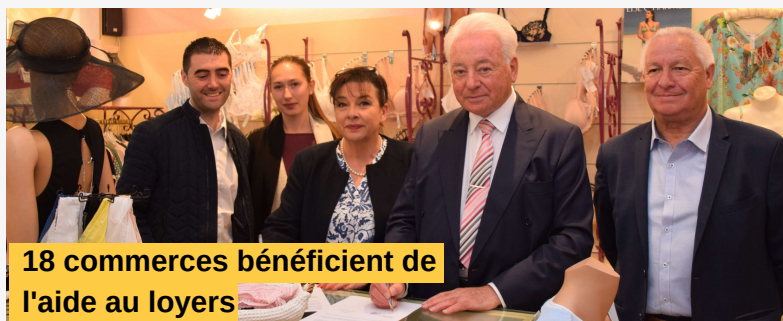
18 commerces bénéficient de l'aide au loyers

Il sera conduit via un comité de pilotage incluant la CCSB, les unions commerciales et les différentes chambres consulaires, afin de compenser l'absence du Fonds d'Intervention pour les Services, l'Artisanat et le Commerce (FISAC) sur le territoire.